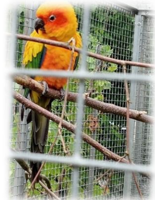
Vogelpark Ambigua Zeihen

In den Herbstferien war es eine kleine Kindergruppe, welche motiviert und aktiv zum Thema Indianer beigesteuert hat.